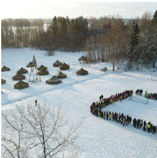
UPL:n talvileiri 2023, Pellin leirikeskus (Asko Valkeinen)

Talvileiri järjestettiin helmikuussa, osallistujia oli 244. Lisäksi järjestettiin UPL:n toimihenkilöiden viikonloppuleiri Metsäpirtillä kesäkuussa, johon osallistui 35 henkilöä. Syysleiriä ei järjestetty 2023.