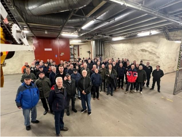
Veteraaneja Roihupellon paloautomuseossa.