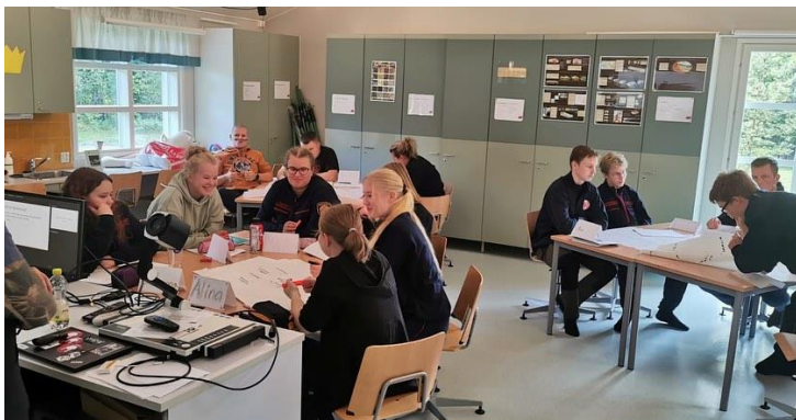
Palokuntanuoria NOK/NOJ-kurssilla

Nuorisotyötoimikunta järjesti kaksi koulutusta syyskuussa, nuoriso-osaston kouluttajakurssin (15 osallistujaa) sekä samaan aikaan nuoriso-osaston johtajakurssin (3 osallistujaa). Liiton toimistolla kävi kuusi palokunnan nuoriso-osastoa kuulemassa varautumisesta ja väestönsuojasta, yhteensä 57 nuorta ja ohjaajaa.