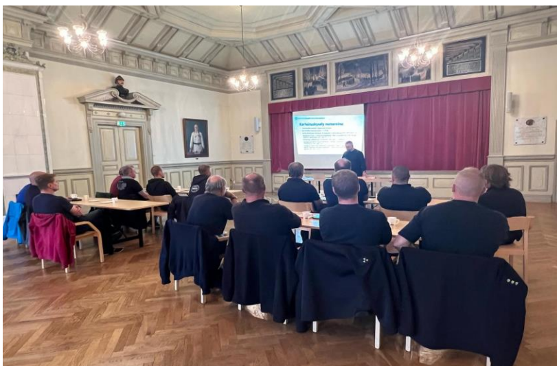
Alueellinen päällystötapaaminen itä-Uudellamaalla, Porvoon VPK:lla

Ohjelman puitteissa toteutettiin tarkempi kartoituskysely palokuntien päällystöille tuen tarpeista ja toivotuista tukimuodoista. Tämän lisäksi jokaisella alueella järjestettiin tapaaminen kyseisen alueen päällystöjen jäsenten kesken sekä vuoden loppuksi koko alueen yhteinen päällystöseminaari.