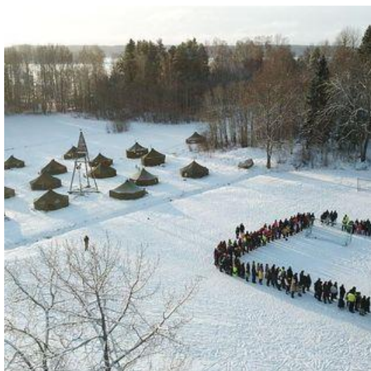
UPL:n talvileiri 2023, Pellin leirikeskus (Asko Valkeinen)

Talvileiri järjestettiin helmikuussa, osallistujia oli 244. Lisäksi järjestettiin UPL:n toimihenkilöiden viikonloppuleiri Metsäpirtillä kesäkuussa, johon osallistui 35 henkilöä. Syysleiriä ei järjestetty 2023.